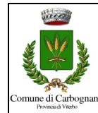
Comune di Carbognano Provincia di Viterbo