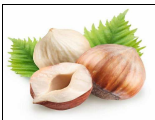
Agrinola Società Cooperativa Soc. Coop. Agr.

Organizzazione Produttori Frutta in Guscio