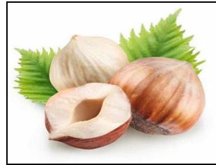
Agrinola Società Cooperativa Soc. Coop. Agr.