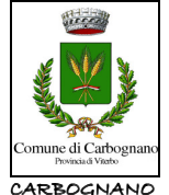
Comune di Carbognano Provincia di Viterbo

nel Comune di Bomarzo : NO nel Comune di Corchiano : NO nel Comune di Gallese : NO nel Comune di Vasanello : NO