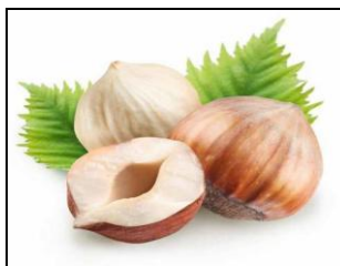
Agrinola Società Cooperativa Soc. Coop. Agr.

Organizzazione Produttori Frutta in Guscio