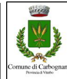
COMUNE DI CARBOGNANO Provincia di Viterbo

nel Comune di Bomarzo : NO nel Comune di Corchiano : NO nel Comune di Gallese : tutte le zone nel Comune di Vasanello : NO